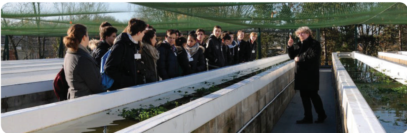
Visite de l'INERIS par les élèves du lycée Saint Vincent de Senlis - 9 décembre 2015.